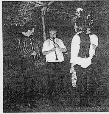
A SINISTRA e sotto alcuni momenti della visita-spettacolo "Tra-ghetto". Al CENTRO, un tratto dell'Aposa e A DESTRA I Vladah